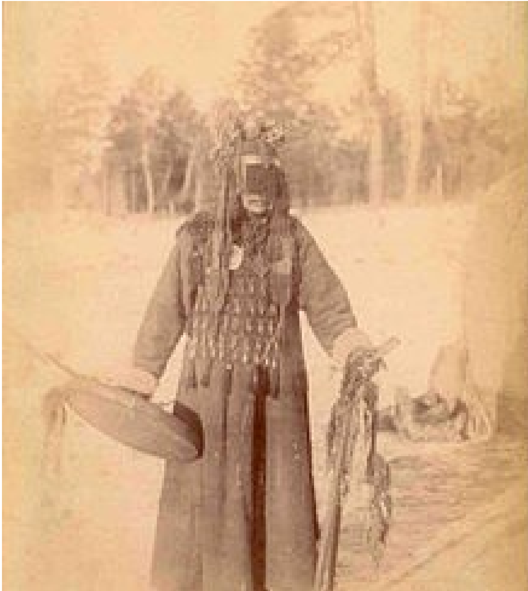
Chaman Sibérien — Toungouse — 1838